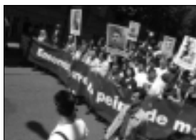
Marche pacifique de 5 000 citoyens dans les rues de Strasbourg pour dire NON à la peine de mort, en clôture du Congrès.