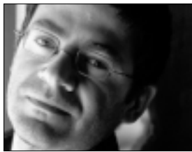
WAJDI MOUAWAD Auteur, metteur en scène et directeur artistique du Théâtre de Quat'Sous.

Dans le contexte actuel, en plus de la question « Est-ce que l'État a le droit de décider de la vie ou de la mort de ses citoyens? », du point de vue du droit international, le sujet est devenu d'une criante actualité. Aujourd'hui avec les nouvelles menaces comme la criminalité internationale ou des questions comme récemment en Irak, le jugement de Saddam Hussein, certains réclament la peine de mort. Il y a également d'autres aspects. Si on abolit la peine de mort, quelles mesures prend-on pour assurer la sécurité dans la société? Comment dissuader le terrorisme? Il y a aussi des stratégies que l'on doit mettre en place lorsque l'on n'a pas la peine de mort.