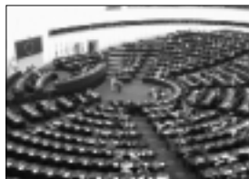
Séance solennelle du 1 er Congrès mondial contre la peine de mort, dans l'hémicycle du Parlement européen de Strasbourg (juin 2001).