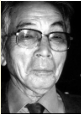
Figure de proue du mouvement abolitionniste japonais, Sakae Menda tire sa force des longues années passées dans le couloir de la mort nippon. Pour ce militant de 78 ans, son injustice ne sera réparée qu'au jour de l'abolition.

« En échappant à la potence, il devient, à 58 ans, le premier miraculé nippon »