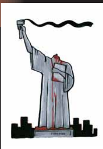
Ci-contre, dessin d'Hungerer.