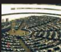
Hémicycle du parlement de Strasbourg : les élus jouent en général un rôle déterminant dans le combat pour l'abolition.