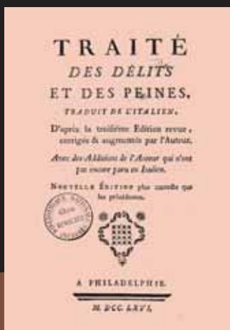
L'ouvrage Des délits et des peines , publié en 1764, dessine les bases d'un ordre juridique rénové, sans peine de mort.