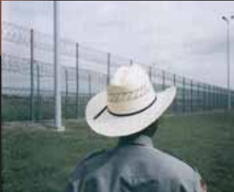
Prison de Huntsville, Texas, capitale américaine de la peine de mort. Photos de Jérôme Brezillon.

Depuis que la Cour suprême a levé le moratoire sur les exécutions en 1976, 1057 condamnés ont été exécutés aux États-Unis à la date du 1 er janvier 2007. La peine de mort se concentre dans quelques États : Texas, Floride, Oklahoma, Virginie, Missouri. Les anciens États esclavagistes recourent le plus à la peine de mort mais c'est en Californie que le plus de condamnés attendent leur exécution. L'actuel président des États-Unis, fervent partisan de la peine capitale, a autorisé la reprise des exécutions au niveau fédéral en 2001. Les personnes pauvres et les minorités (notamment afro-américaine et hispanique) sont les premières victimes d'un système judiciaire profondément inégalitaire.