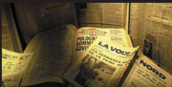
Une revue de la presse française en 1981 lors du débat sur l'abolition.