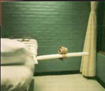
Puissance et liberté obligent, la peine de mort aux États-Unis suscite mobilisations et protestations de l'opinion publique internationale.