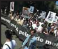
Manifestation d'ECPM contre la peine de mort lors du Congrès de Strasbourg, qui s'est tenu du 21 au 23 juin 2001.