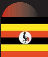
En Ouganda, sans pour autant interdire la peine de mort, la Cour suprême a commué début 2005 toutes les condamnations à mort : elle a considéré que l'attente dans les couloirs de la mort pendant plus de 3 ans était un acte de torture et jugé inconstitutionnelle l'automatisme de la condamnation à mort, un juge devant avoir une faculté d'interprétation. Cette décision pourrait inspirer d'autres Cours suprêmes dans le monde.