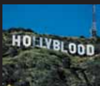
Hollyblood : au lendemain du festival du film américain de Deauville en 2001, ECPM proposait à tous les amoureux du 7 e art cette évocation détournée de Hollywood, dans l'espoir de mobiliser des artistes américains en faveur de l'abolition.