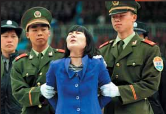
Une femme crie à l'annonce de sa sentence de mort le 11 avril 2001.

L'attribution des Jeux à Pékin aura entraîné une recrudescence des exécutions, notamment dans la région de Pékin, dans le cadre d'une politique globale de nettoyage à marche forcée et de transformation de la capitale chinoise. C'est un fait tragique que nul ne peut ignorer. Ceci dit, à l'appui du dialogue officiel que l'Union européenne et la Suisse entretiennent avec Pékin sur les droits de l'homme, les Jeux constituent une opportunité unique pour la communauté internationale de faire pression sur la Chine pour l'encourager à adopter des mesures concrètes de respect des droits humains. Aux citoyens et sportifs européens de militer en ce sens.