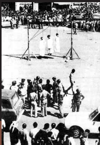
La pendaison demeure, aujourd'hui encore, l'un des modes d'exécution les plus répandus. Ici, une potence en Palestine.