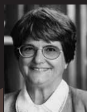
SŒUR HELEN PREJEAN

« La peine de mort est pour moi un cataclysme »