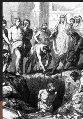
Deux gaulois enterrés vivants en 232 av. J.-C. (gravure d'A. Pannemaker d'après Félix Philippoteaux XIX e siècle, coll. part.)