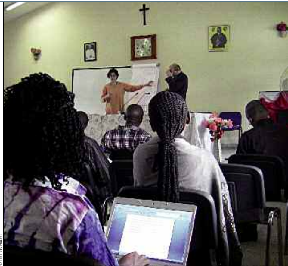
Une quarantaine de journalistes congolais assistent à un séminaire de sensibilisation à l'abolition organisé par l'association italienne Hands off Cain.